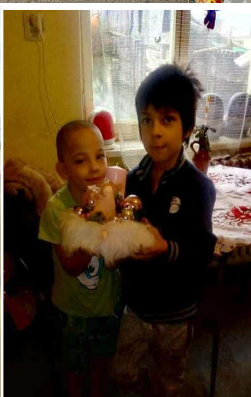
Štipendiá pre sociálne znevýhodnených žiakov